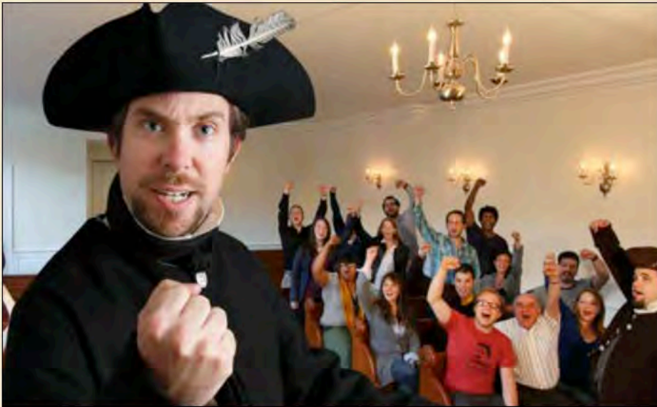
Samuel Adams leads a spirited town meeting (Samuel Adams dirige un rassemblement des citoyens animé)

» – lettre des Fils de la Liberté (Sons of Liberty), 29 nov. 1773