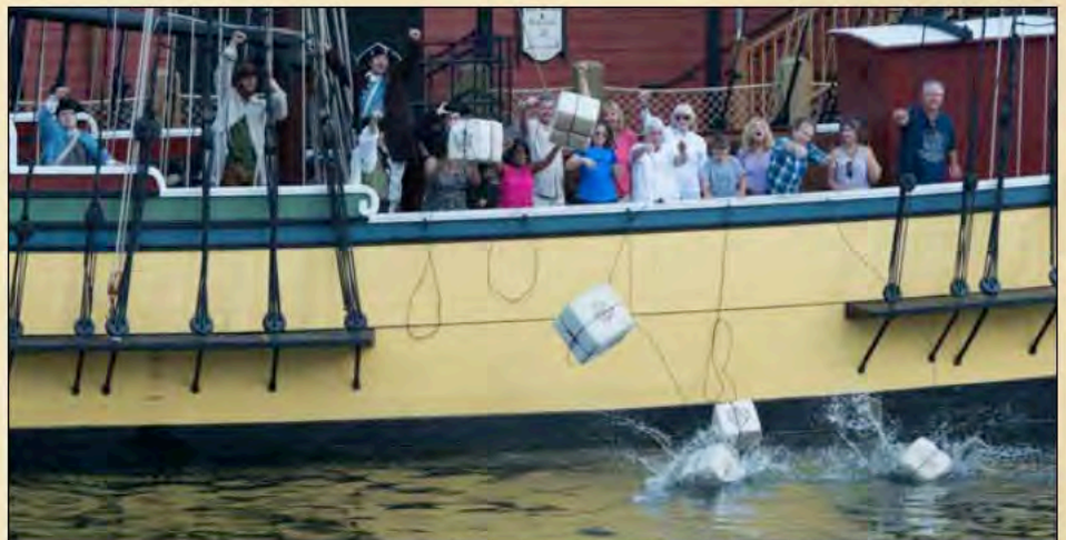
¡Destrucción del té en el puerto de Boston!