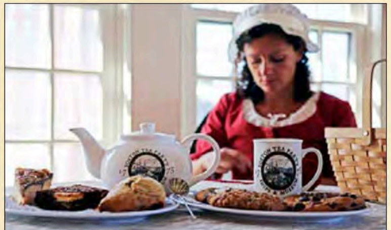
Abigail's Tea Room (Le salon de thé d'Abigail)

Au nom des navires et du musée de la Boston Tea Party, et de Historic Tours of America, nous vous remercions de votre visite ! Pensez à vous arrêter au Salon de thé d'Abigail qui met en vedette les thés historiques impliqués dans la Boston Tea Party, ainsi que de délicieux sandwiches, cookies et autres rafraîchissements.