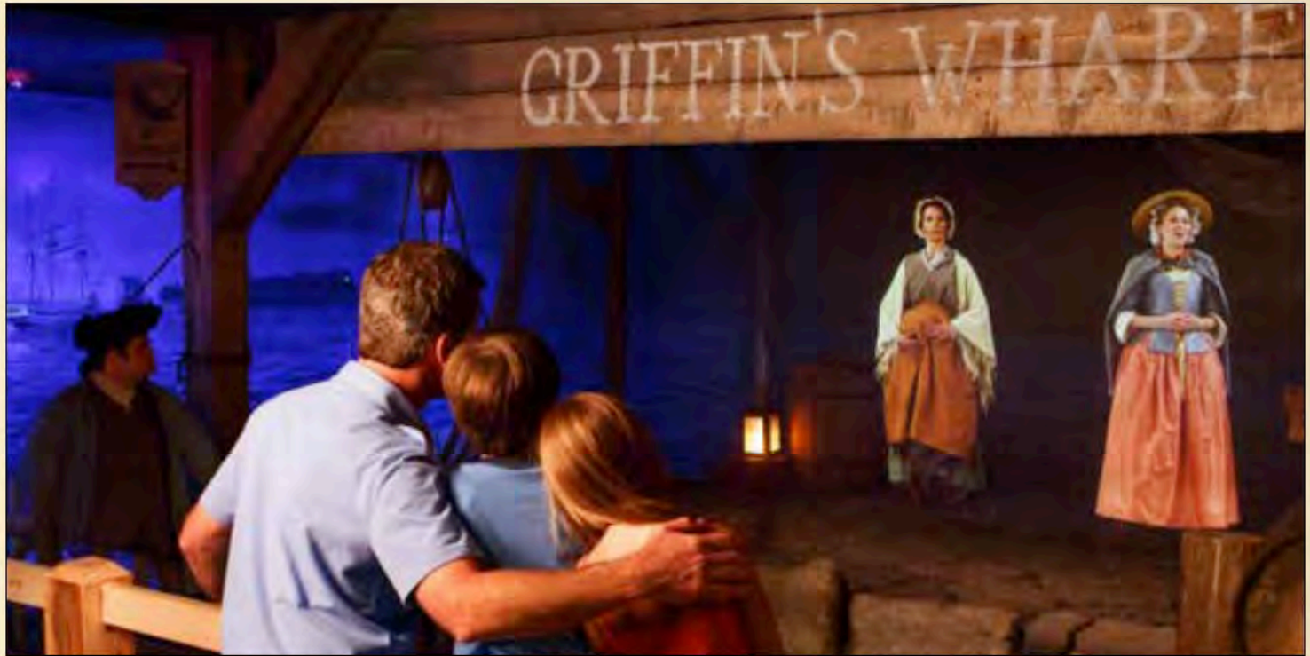
Noticias de un Patriota y un Tory la mañana después al Motón del té de Boston

Pendant que votre voyage se poursuit sur le quai de Griffin, vous allez apprendre de nouveaux détails sur les événements de la nuit et ceux impliqués dans la Destruction du thé. Retrouvez le nom de votre personnage sur la liste des participants à la Boston Tea Party ! Dans le passé, les protestations de Boston étaient souvent violentes voire séditeuses ! Cependant, cette nuit-là, les Fils de la Liberté n'ont heurté aucun membre de l'équipage et un seul produit autre que le thé a été détruit. Un seul cadenas fut détruit sur le Dartmouth au cours des événements de la nuit, mais les Fils de la Liberté l'ont secrètement remplacé par un cadenas fonctionnel dès le lendemain matin !