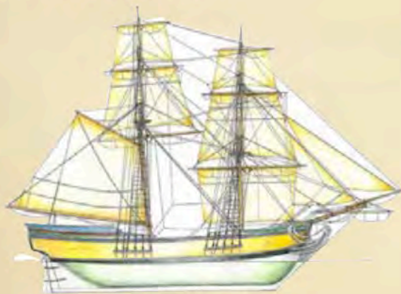
El bergatín Beaver