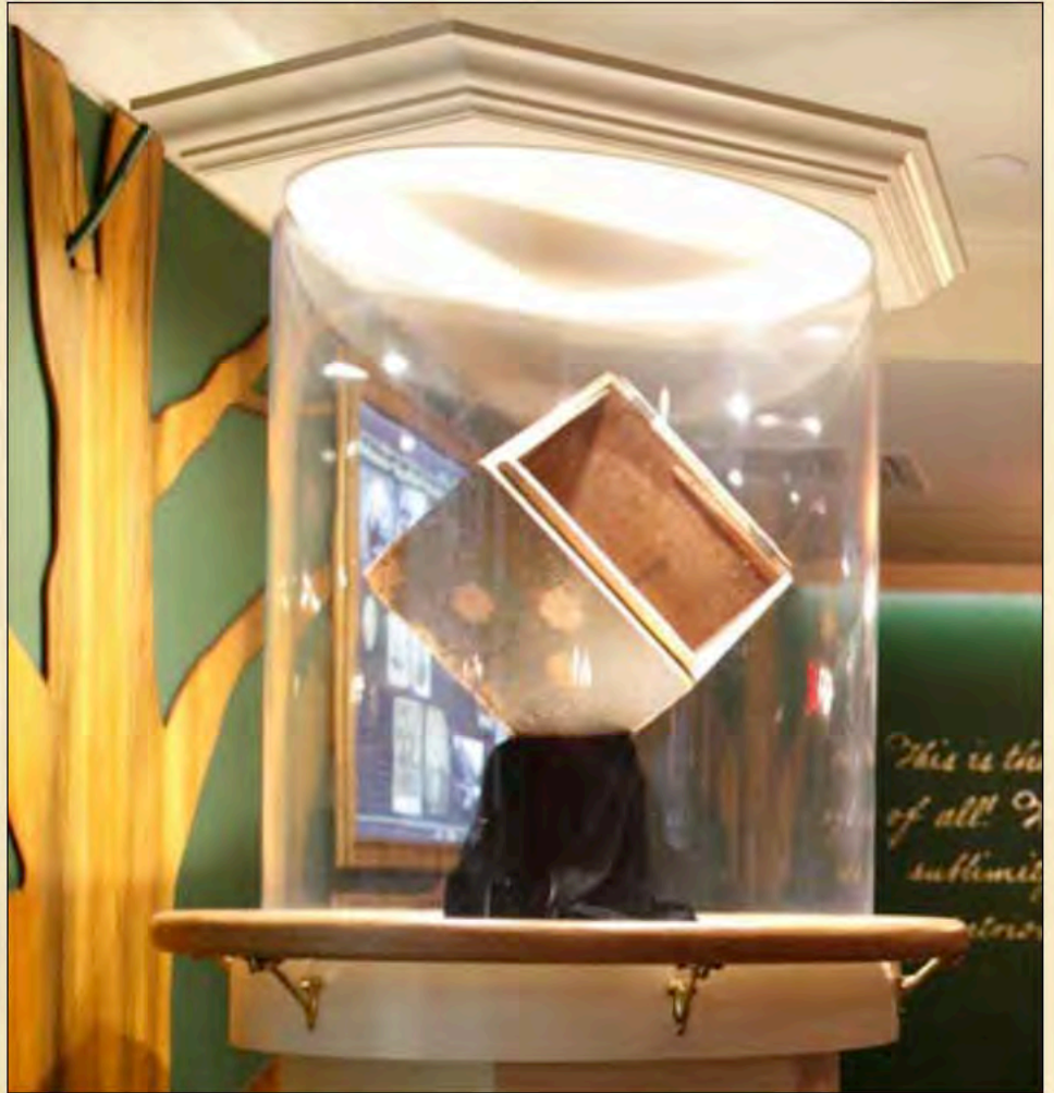
El medio cofre Robinson

Cette demi-caisse sobre a survécu à la traversée transatlantique ; elle a été ouverte à la hache, submergée par l'eau de mer, et elle a inspiré une révolution. Aujourd'hui, elle repose sur le même plan d'eau que celui dans lequel elle a été coulée au cours de cette nuit fatidique de 1773. Ce trésor américain est prêt à inspirer une nouvelle génération de patriotes. Il s'agit vraiment d'une « caisse qui mérite d'être conservée ».