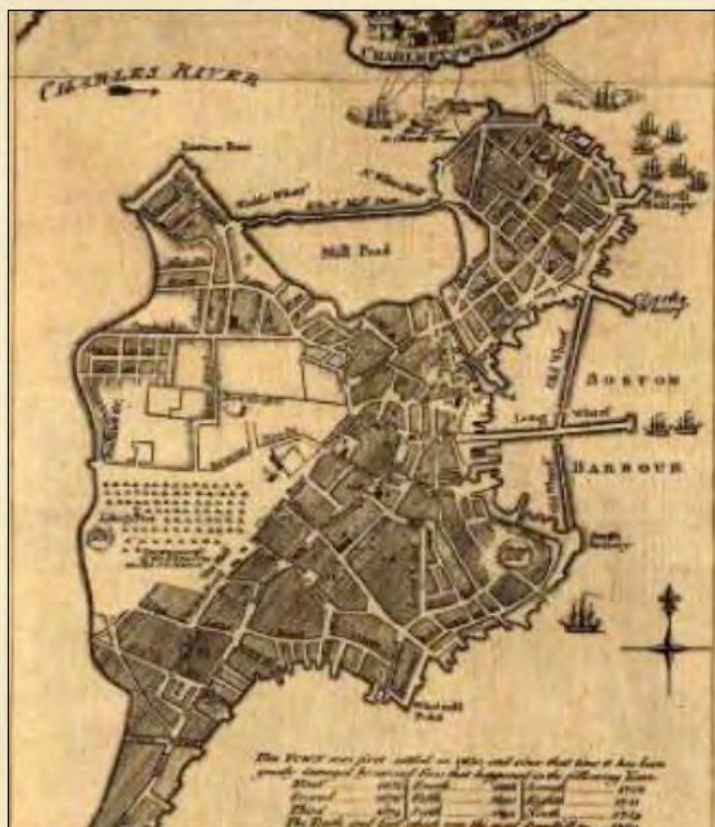
Boston alrededor de 1773

les colonies ont sans cesse été taxées par le roi George III et le Parlement sans même que ces colonies ne soient représentées au sein du gouvernement britannique. Le Stamp Act permettait de taxer toutes les marchandises, même les jeux de cartes et les dés ! Les Townshend Acts imposaient une taxe sur le plomb, la peinture, le verre et le thé. Les Fils de la Liberté ont protesté contre les taxes qu'on leur avait imposées antérieurement, sans représentation, souvent au moyen de manifestations, pétitions et boycotts des marchandises du commerce britannique. Les actions menées par les Patriotes ont entraîné l'abrogation de ces anciennes lois, mais Boston se réunit à présent pour protester contre cette nouvelle taxe sur le thé. En attendant le retour de Francis Rotch, vous serez dirigé par un Patriote puisque le Corps du Peuple (Body of the People) a décidé que « le thé infusera dans l'eau salée ce soir ». Samuel Adams mettra fin au rassemblement en donnant le signal secret, « Il n'y a rien de plus qu'un rassemblement puisse faire pour sauver ce pays ! ». Enfilez votre costume de Mohawk symbolique et suivez votre Patriote jusqu'au quai de Griffin !