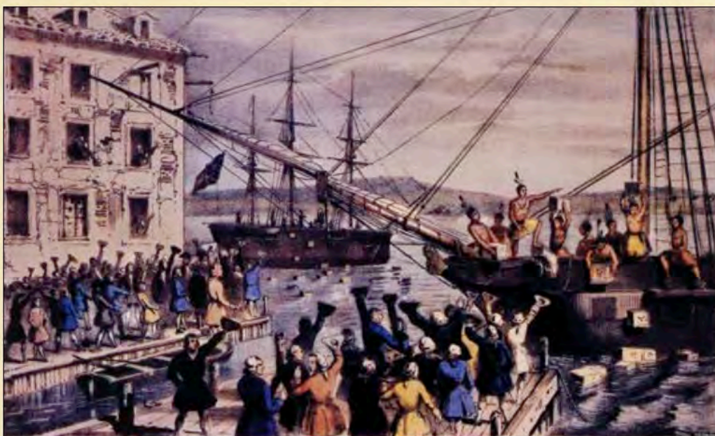
El Motín del té de Boston, 16 de diciembre de 1773