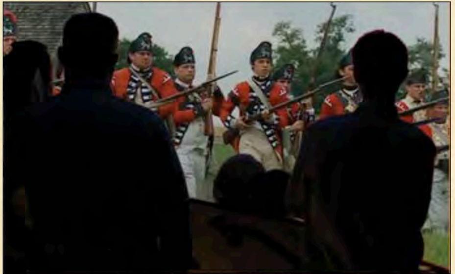
Los casacas rojas toman Lexington Green

Seize mois se sont écoulés depuis la Boston Tea Party. Les Intolérable Acts ne sont pas parvenus à soumettre Boston mais plutôt à attiser le feu de la Révolution. La tension montante a entraîné la destitution du Gouverneur Thomas Hutchinson. Son remplaçant, le Général Thomas Gage, impose la loi martiale et bloque le port de Boston. Ce différend entre l'Angleterre et ses colonies n'est plus au sujet des taxes, il a évolué. Quelque chose a changé dans le cœur et l'esprit des gens. Une résolution du conflit entre la Couronne et les colonies sur le champ de bataille semble désormais inévitable.