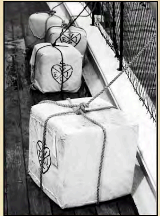
La marca de comerciante de la Compañía Británica de las Indias Orientales

Une fois le thé détruit, vous pourrez visiter la cale et la cabine arrière du navire. Sous les ponts, vous trouverez une multitude de cargaisons, notamment des barils d'huile de baleine, de rhum et de mélasse, ainsi que des barils de pin contenant du blé et d'autres produits. Vous trouverez plusieurs malles contenant des fournitures et du mobilier pour les maisons. Vous pourrez même tomber sur le capitaine du navire en train d'écrire dans son journal au sujet des événements qui viennent de se produire.