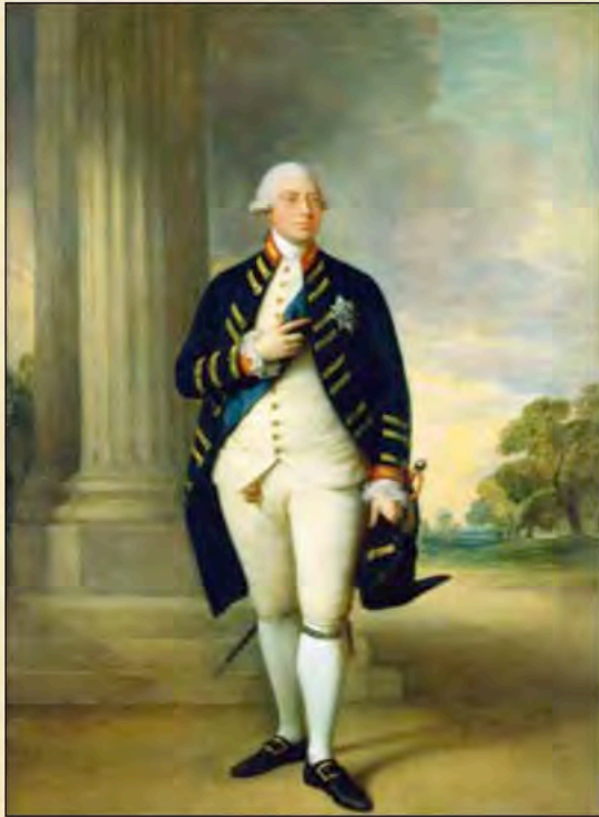
Rey Jorge III